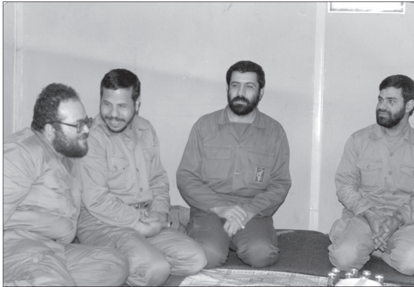
برادر محمد کوثری فرمانده لشکر ۲۷ محمد رسول الله (ص) در جمع تعدادی از مسئولان لشکر.